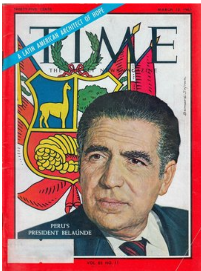
Time Magazine Cover March 1965 - Belaunde A Latin American Architect of Hope

Managementul său prezidențial a fost orientat către lucrări publice de mari dimensiuni: construcția de drumuri, aeroporturi, complexe de locuințe, sisteme edilitare, de irigații și energetice. De asemenea, a restabilit originea democratică a autorităților municipale. Maniera coerentă, pragmatică și cu evidente preocupări sociale ale președintelui arhitect a atras atenția lumii vestice, așa cum specifică revista Americana Time pe coperta unui număr din 1965.