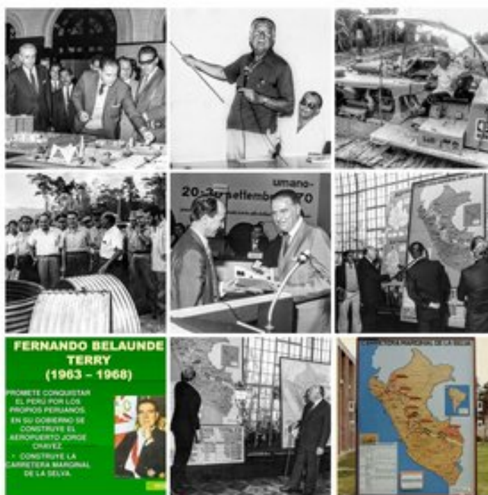
FERNANDO BELAUNDE TERRY în acțiune - 1963 – 1968

În primul său mandat s-au realizat acțiuni majore cu impact social, dar în special proiecte de infrastructură ingierească și s-a inițiat la inițiativa lui Belaunde ambițiosul proiect "Carretera Marginal de la Selva, fiind un proiect important de autostradă, care conectează regiunile amazoniene din Columbia, Ecuador, Peru, Venezuela și Bolivia. Este unul dintre principalele proiecte de infrastructură ale Inițiativei pentru integrarea infrastructurii generale ale Americii de Sud. Pentru această inițiativă Belaunde primește medalia de aur la Bienala de la Rimini-Italia în 1971.